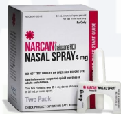
Kits de Narcan