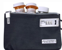
Bolsas de seguridad para medicamentos