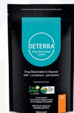
Kits para desechar medicamentos