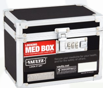
Cajas de seguridad para medicamentos

Estos son algunos de los recursos q nuestra coalición distribuye a la Comunidad.